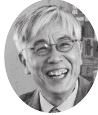
イツセー尾形 (審査委員長)

1946年新潟県生まれ。作家、作詞作曲家、写真家など多方面で活躍。1988年、『尋ね人の時間』で第99回芥川賞受賞。2005年、『この街で』(作詞・新井満、作曲・新井満、三宮麻由子)を制作。 2007年、『千の風になつて』で第49回日本レコード大賞作曲賞を受賞。 2014年、正岡子規の俳句にメロディをつけ、松山市民の愛唱歌「春や昔」を制作。子どもから大人まで松山市民に愛される曲となる。 2018年、『石鎚山』を作詞・作曲。