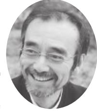
新井 満 (名誉審査委員長)

1946年新潟県生まれ。作家、作詞作曲家、写真家など多方面で活躍。1988年、『尋ね人の時間』で第99回芥川賞受賞。2005年、『この街で』(作詞・新井満、作曲・新井満、三宮麻由子)を制作。 2007年、『千の風になつて』で第49回日本レコード大賞作曲賞を受賞。 2014年、正岡子規の俳句にメロディをつけ、松山市民の愛唱歌「春や昔」を制作。子どもから大人まで松山市民に愛される曲となる。 2018年、『石鎚山』を作詞・作曲。