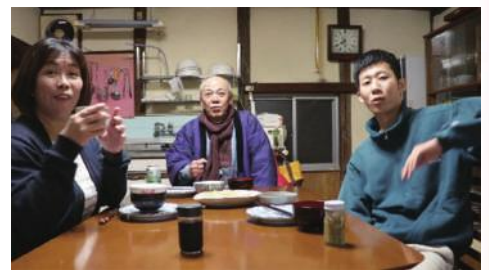
入賞 境 晃史 原作：野本 浩慎『思いやる気』