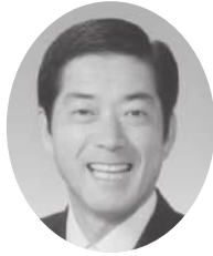
中村 時広 (審査委員)

1983年愛媛県松山市生まれ。 俳人。明治大学・聖心女子大学講師。 松山東高等学校在学中、俳句甲子園をきっかけに俳句をはじめ。歴代最年少で桂信子賞を受賞するなど、若手俳人のリーダー的存在として活躍。「HAIKU LABO」を立ち上げ、愛媛の観光やものづくりを俳句で発信する。 2019年、『日めぐり子規・漱石 俳句でめぐる365日』で第34回愛媛出版文化賞受賞。著書にエッセイ集『もう泣かない電気毛布は裏切らない』など。2020年、最新句集『すみれそよぐ』刊行。