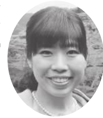
神野 紗希 (審査委員)

1952年福岡県生まれ。 1982年より現在まで続く「フツの人の日常を描く」一人芝居を開始。 一方で映画にも出演。 2003年「トニー滝谷」(市川準監督) 2005年「太陽」(アレクサンドル・ソクーロフ監督) 2016年「沈黙」(スコセッシ監督) TVでは「未解決事件警察庁長官狙撃事件」「カルテット」「天国からのラブソング」「トツカイ」「神様のカルテ」など多数。 雑誌「モンキー」にてシェイクスピアのカバー小説を掲載中等幅広く活動中。 一貫して人間讃歌を表現し続けている。