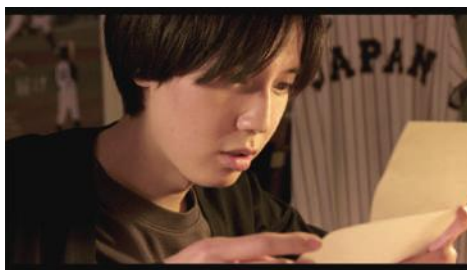
入賞 エンカクテイ 原作：野本 浩慎『思いやる気』