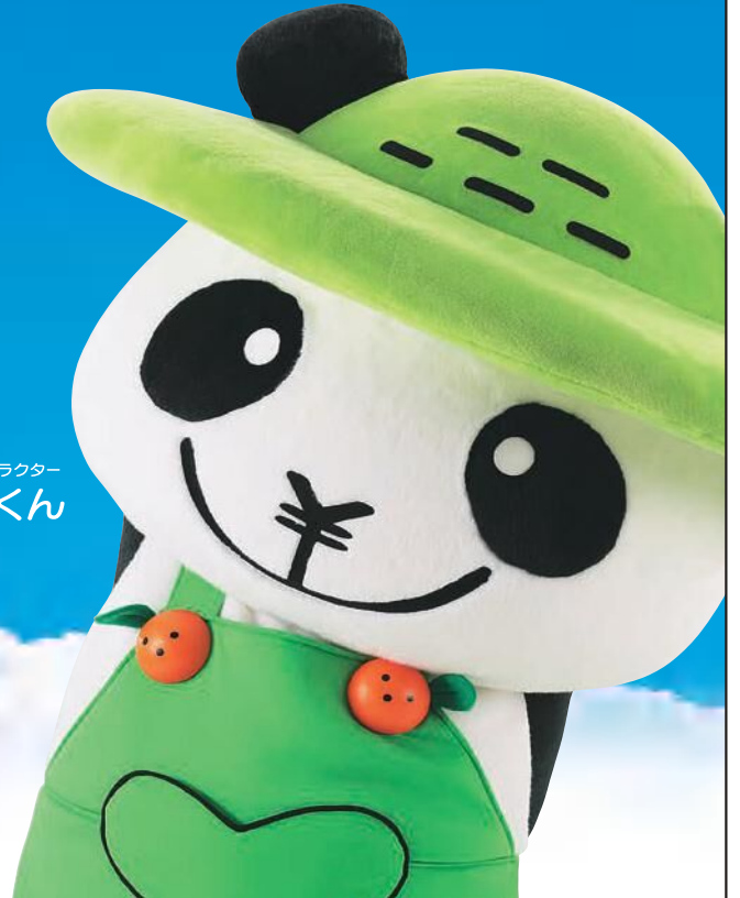
JAバンクえひめキャラクター ぱんじゃくん

JAバンクえひめでは、食と農業に対する学習や農業体験などを はじめとした様々なCSR活動を通じて、 自然と調和・共生できる 循環型社会の実現をめざし、地域の皆様の 豊かな未来の実現に取り組んでいます。