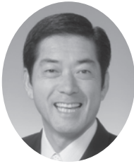
愛媛県知事 中村 時広 (審査委員)

1983年愛媛県松山市生まれ。 俳人。聖心女子大学講師。 松山東高等学校在学中、俳句甲子園をきっかけに俳句をはじめ。歴代最年少で桂信子賞を受賞するなど、若手俳人のリーダー的存在として活躍。「HAIKULABO」を立ち上げ、愛媛の観光やものづくりを俳句で発信する。 2019年、「日めくり子規・漱石 俳句でめぐる365日」で第34回愛媛出版文化賞大賞。 著書にエッセイ集「もう泣かない電気毛布は裏切らない」など。 2020年、最新句集「すみれそよぐ」刊行。